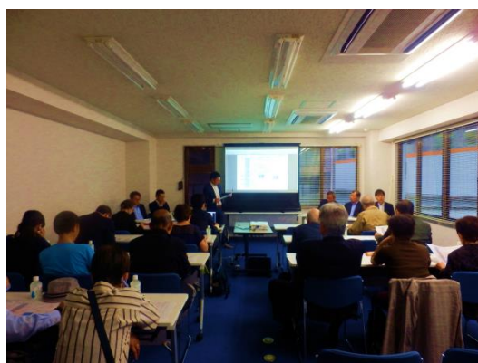
【第2回 管理運営検討会の様子】