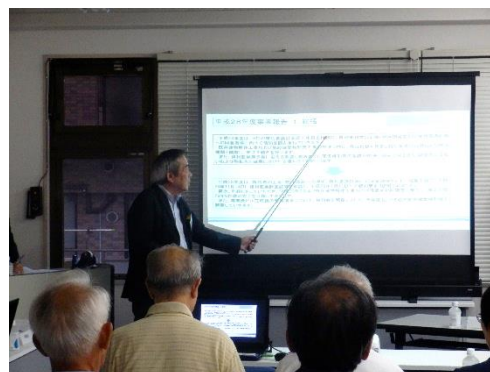
【平成29年度通常総会の様子】