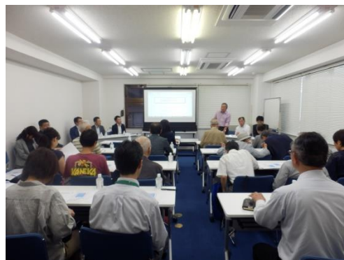
【第3回 管理運営検討会の様子】