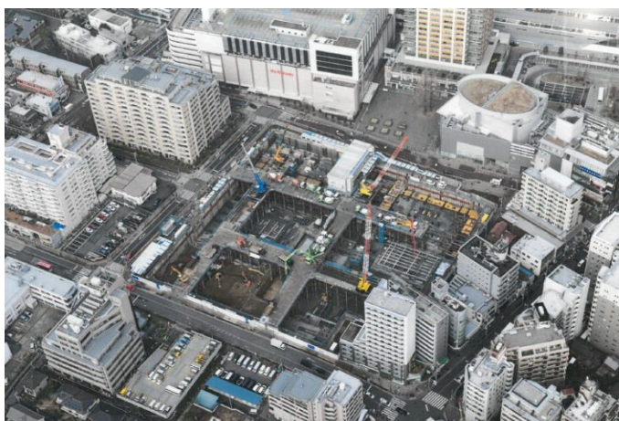
【写真④新築工事の俯瞰写真】