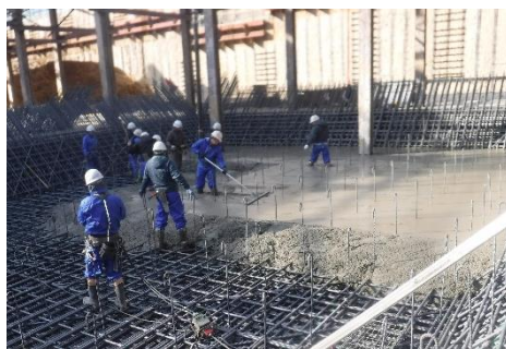
【写真②コンクリートの打設】