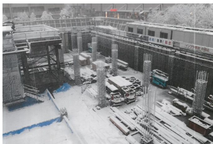
【写真⑤降雪翌日の現場の様子】