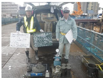
【写真①スランプ試験の様子】

皆さまには今後も騒音や交通規制等ご迷惑をおかけすると思いますが、ご理解とご協力のほどよろしくお願い致します。