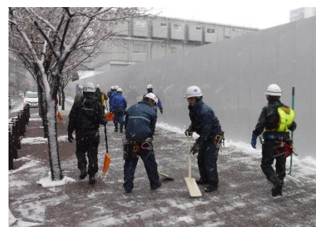
【写真③除雪作業の様子】