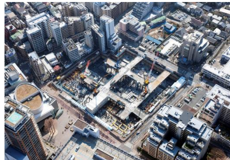
【写真③新築工事の俯瞰写真】