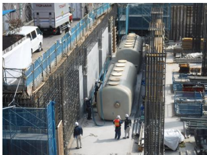
【写真①ディスポーザータンク 据付】

皆さまには今後も騒音や交通規制等ご迷惑をおかけすると思いますが、ご理解とご協力のほどよろしくお願い致します。