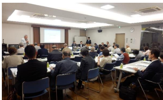
【区分所有予定者集会の様子】