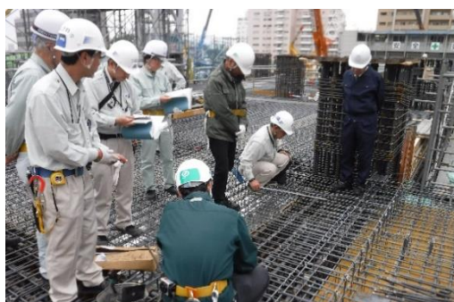
【写真①東京建築検査機構による中間検査の様子】

皆さまには今後も騒音や交通規制等ご迷惑をおかけすると思いますが、ご理解とご協力の程よろしくお願い致します。