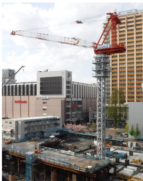
【写真③タワークレーンの様子】