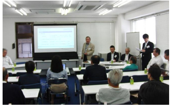
【平成30年度第1回臨時総会の様子】