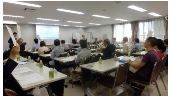
【平成30年度通常総会の様子】