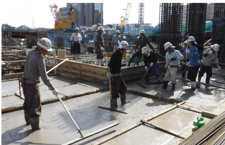
【写真①コンクリート打設の様子】

皆さまには今後も騒音や交通規制等ご迷惑をおかけすると思いますが、引き続きご理解とご協力の程よろしくお願い致します。