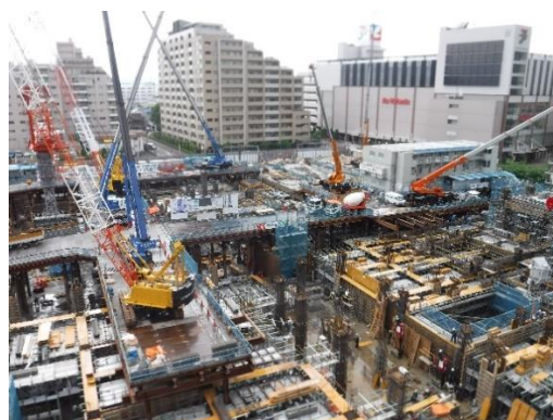
【写真③全体の俯瞰写真】