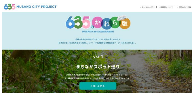
【635のかわら版のページ】

https://www.musashikoganei-saikaihatsu.jp/