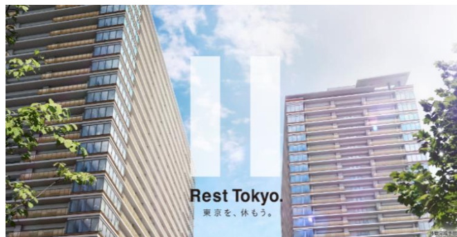
【マンションホームページのトップページ】

ホームページアドレス： https://www.proud-web.jp/mansion/b114170/