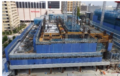
【写真②西側 A 棟の様子】