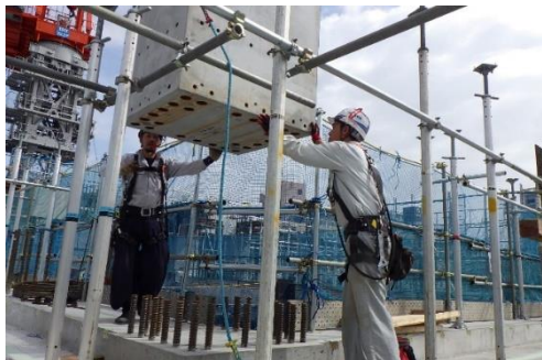
【写真①プレキャストコンクリート柱の組み立ての様子】

皆さまには今後も騒音や交通規制等ご迷惑をおかけすると思いますが、引き続きご理解とご協力の程よろしくお願い致します。