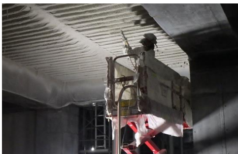
【写真③天井不燃断熱材吹き付けの様子】