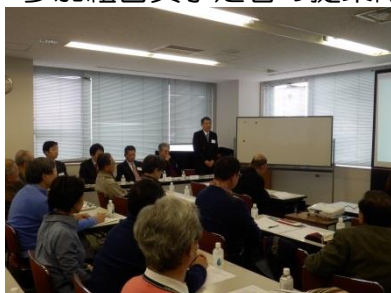
(理事長による挨拶)