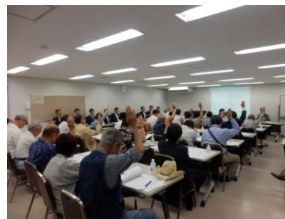
議案は全て可決されました