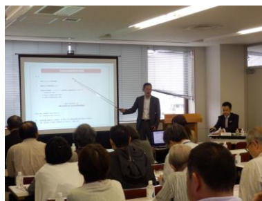
総合コーディネーターによる説明

再開発の税務は難解な部分もありますので、ご不明な点やご質問については、ぜひ事務局までお問い合わせください。