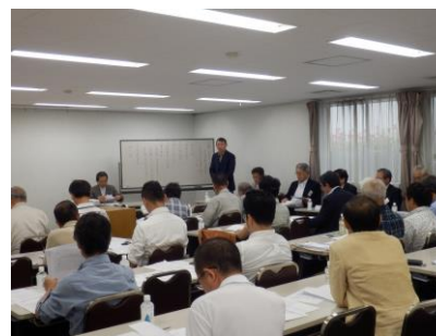
理事長による挨拶

これを受け、6月18日(木)に発起人より組合設立認可申請書を小金井市に提出し、6月19日(金)に市の進達を得て、東京都に提出されました。今後、都庁内の手続きを経て、今年の8月下旬頃に東京都より再開発組合設立の認可・公告がなされる予定です。