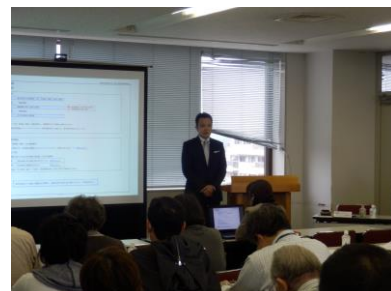
税務会計コンサルタントによる説明