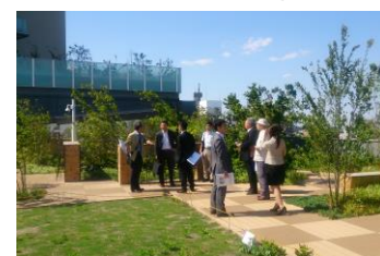
大泉学園駅再開発 見学の様子②