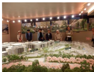
阿佐ヶ谷マンションギャラリー 見学の様子

今後も権利者の皆様の再開発に対するご理解を深めるため、見学会や視察会を企画したいと考えておりますので、皆様ぜひご参加をお願いいたします。